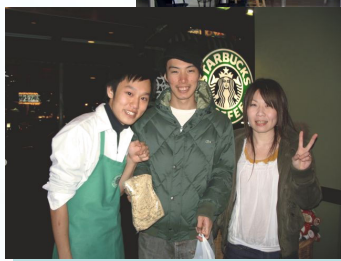
学生時代 福祉の道を 志した頃

私は小さい頃、おばあちゃん子でした。学生時代はスターバックスで働き、就職活動中は大好きなアパレルの仕事と迷いましたが、より心から感謝されるのはどちらか、高齢者の笑顔に出会える仕事がしたいと思って最終的に介護の仕事を選びました。