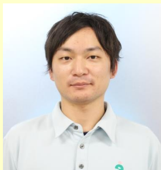
西 優 かりんチーム