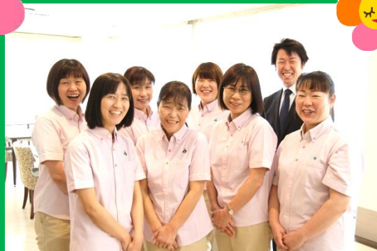
むさしの園ケアマネージャー