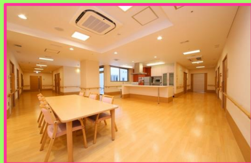
居室写真:1ユニット10名(全個室)