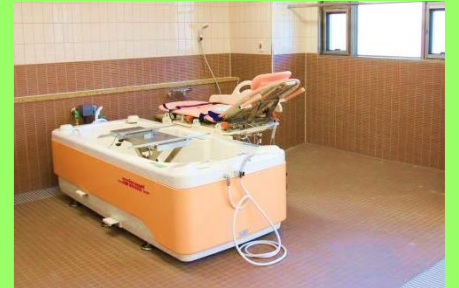
マリンコート(1ヵ所)