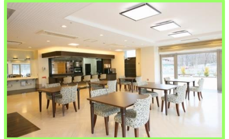
地域交流スペース