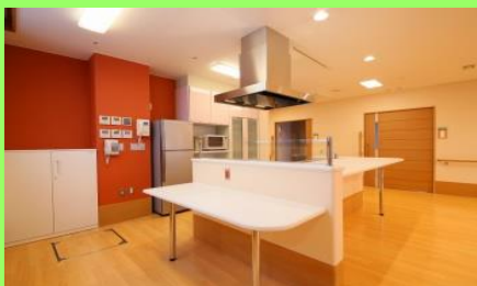
ユニットパントリー

入居者様が快適に生活が送れるよう、設備を整えております。全室個室にエアコン(うるさら)を搭載し、快適な室内環境と、左右対称のバリアフリーお手洗、システムキッチンが搭載されております。